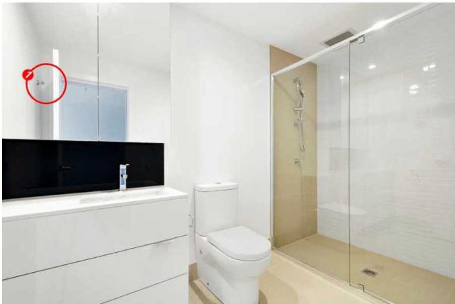
1 Écaille : Trace du porte-manteau sur la porte